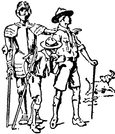
O Chefe Escoteiro guia o jovem com o espírito de um irmão mais velho.