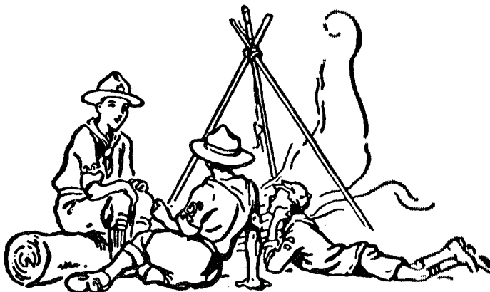
Membros da Família Escoteira.