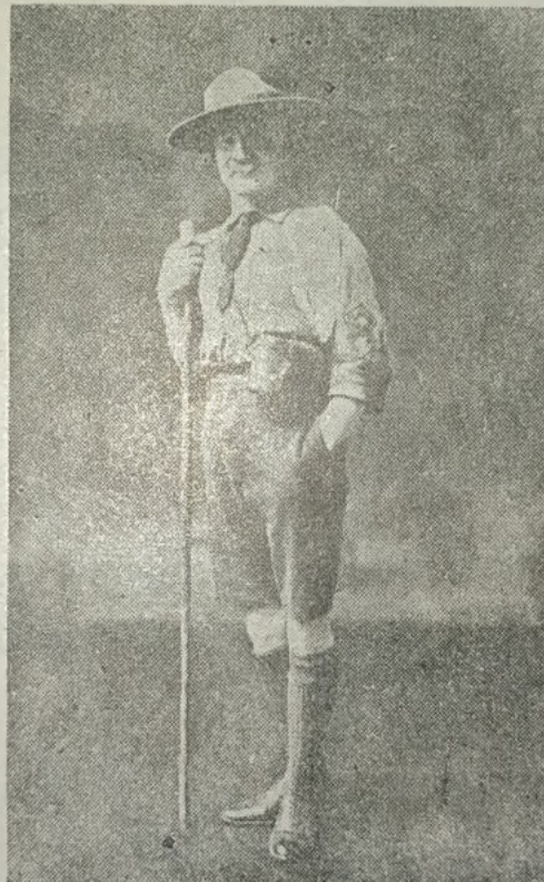
Lord Baden Powell, fundador do Escotismo.

Tenho para mim que Deus nos collocou neste mundo encantador, para que sejamos felizes e gozemos a vida. Porém a felicidade não provém da riqueza, nem de obter, simplesmente, êxito na carreira, nem dando-se gôsto a si mesmo. Um passo para a felicidade é fazer-se saudável e forte quan-