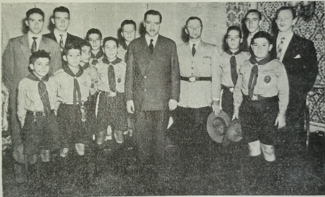
Os Escoteiros de Rezende em visita de cumprimentos ao Governador do Estado do Paraná, Dr. Bento Munhoz da Rocha, que muito se vem interessando pelo Escotismo.

Idealizada pelo monitor Uraci a nossa excursão, foi iniciada, setembro de 1950, a "CAMPAÑA PRÓ-EXCURSÃO", com o fim de angariar donativos para o em-