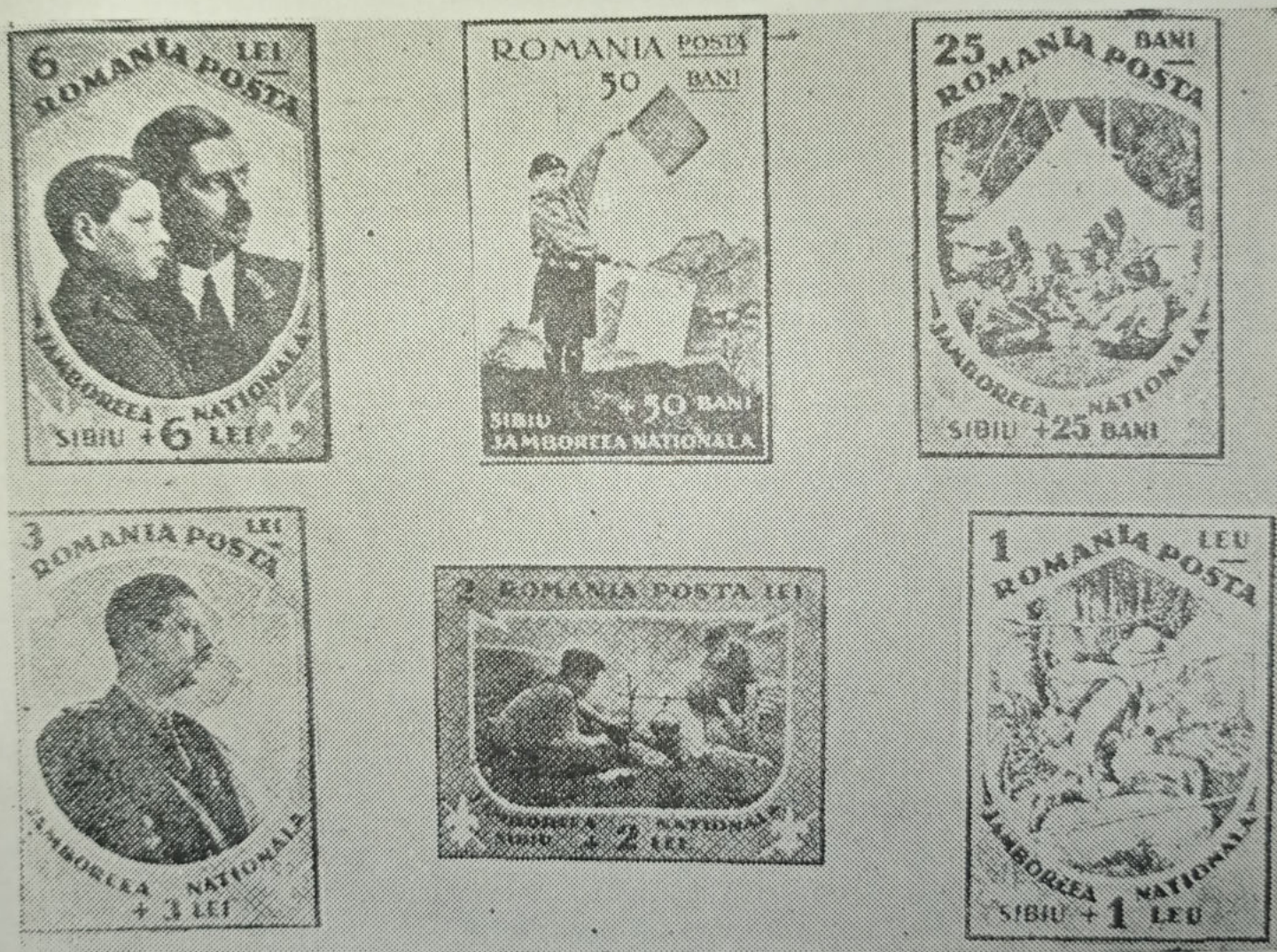
Alguns dos Sêlos Escoteiros que têm sido emitidos numa m̃agnífica propaganda do Escotismo.

Diversos tem sido até hoje, num total aproximado de 18 os países que emitiram selos postais comemorativos de Jamborees Internacionais, Nacionais, Conferências Escoteiras e outras grandes atividades, além de que alguns desses selos, apesar de sua sobretaxa ter sido doada inteiramente em benefício de organizações escoteiras, não apresentam motivos pròpriamente escoteiros, estando contudo relacionados abaixo e fazendo parte integrante da coleção de selos escoteiros.